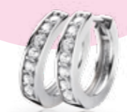
ZIO 191Z 15 x 3mm 39.95