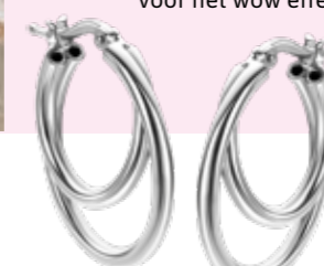
ZIO 2483 multilook oorkingen 23mm 44,95

Geef je earparty net dat beetje extra met een statement ooring. Deze grote zilveren oorkingen met handige bovensluiting zorgen voor het wow effect!