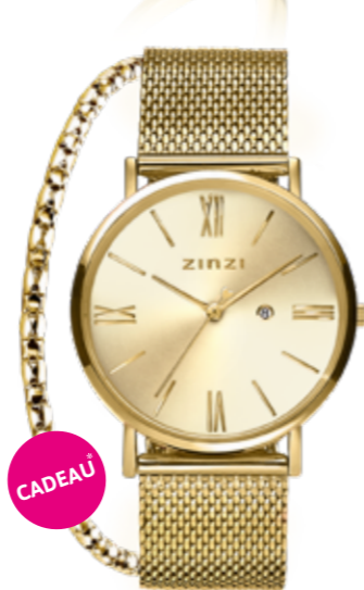
ZIW 510M 34mm 'Roman Gold' 109,-*