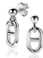
ZIO 2580 oorstekers 18mm 39,95