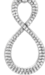
ZIH 2570 hanger 35mm 79.95