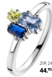
ZIR 2496 44,95