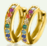
ZIO 2172CR ooringen 15mm 54.95