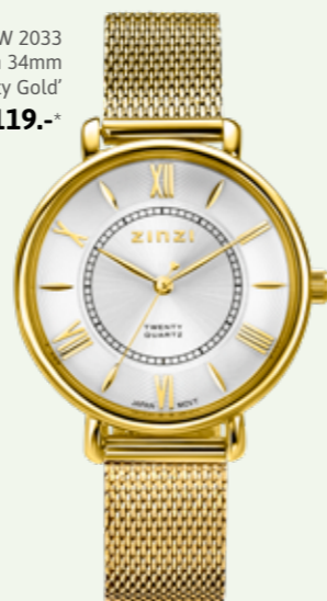
ZIW 2033 watch 34mm 'Twenty Gold' 119.-*