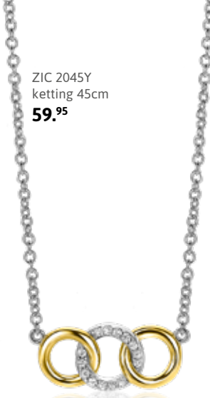
ZIC 2045Y ketting 45cm 59.95