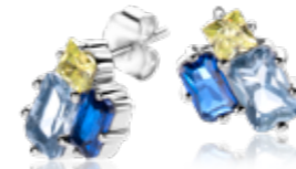
ZIO 2496 oorstekers 10mm 49,95

Zinzi heeft cadeaus voor ieder budget. En voor Moederdag zijn dit betaalbare luxe verwennerijen.