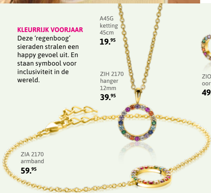
ZIA 2170 armband 59.95

MAAK JE MOEDER BLIJ Met deze luxe zilveren oorknoppen met scharniersluiting maak je haar zeker blij. Mooi om iedere dag te dragen. En deze vrolijk gekleurde oorbedels kun je er makkelijk aan bevestigen.