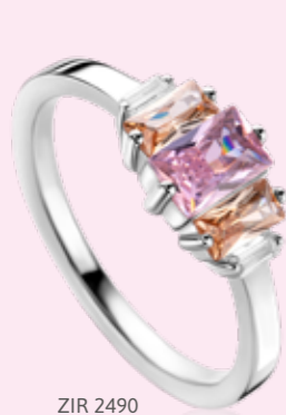
ZIR 2490 49.95