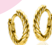
ZIO 2545G 13 x 2mm 39.95