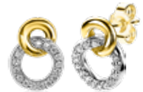
ZIO 2045Y oorknoppen 44.95