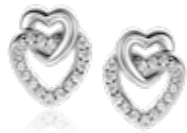
ZIO 2493 oorstekers 10mm 44.95

Laat je moeder stralen op Moederdag en verras haar met een schitterend cadeau!