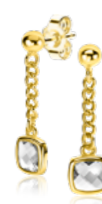
ZIO 2417Y oorstekers 25mm 44.95