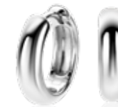
ZIO 2565 luxe oorkingen 15 x 4mm 44,95

Deze zilveren ring met bijpassende oorknoppen geven kleur aan je outfit. Een stralende combinatie van kleuren!