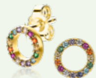
ZIO 2170 | 8mm oorknoppen 49.95