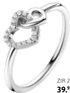
ZIR 2493 39.95