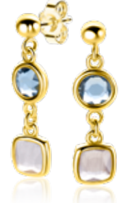
ZIO2526G oorsieraden 28mm 49.95