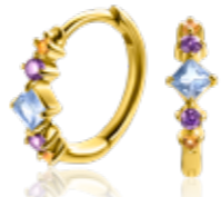
ZIO 2443 oorkingen 15 x 2mm 49,95