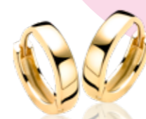
ZIO 191G 15 x 3mm 29.95