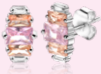
ZIO 2490 oorstekers 13mm 49.95