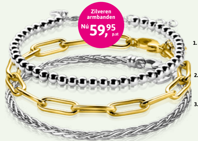
1. ZIA 1010 | 2. ZIA 2286G | 3. ZIA 1912

Zet je moeder in het zonnetje en geef een brede zilveren armband cadeau. En nu extra feestelijk geprijsd!