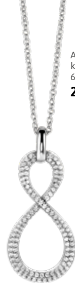
A60 ketting 60cm 24.95