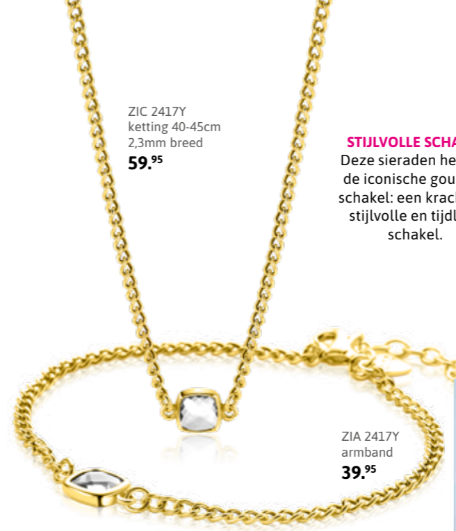
ZIC 2417Y ketting 40-45cm 2,3mm breed 59.95

STIJLVOLLE SCHAKEL Deze sieraden hebben de iconische gourmet schakel: een krachtige, stijlvolle en tijdloze schakel.