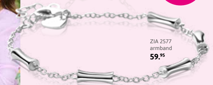
ZIA 2577 armband 59,95

Speciale SETPRIJS Nú 129,95 armband+ketting