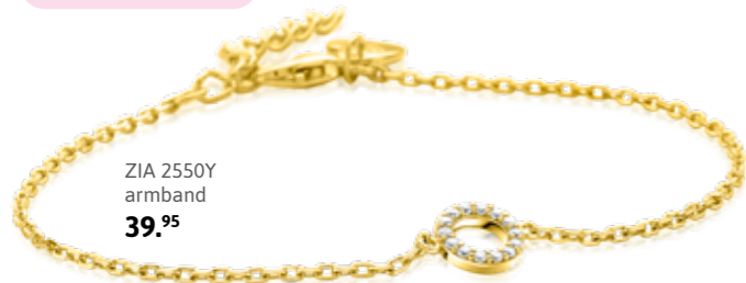
ZIA 2550Y armband 39,95