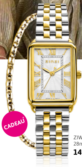
ZIW 1907 28mm 149.-*