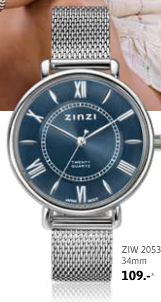
ZIW 2053 34mm 109.-*

*Nu met gratis zilveren Zinzi armband t.w.v. 34,95