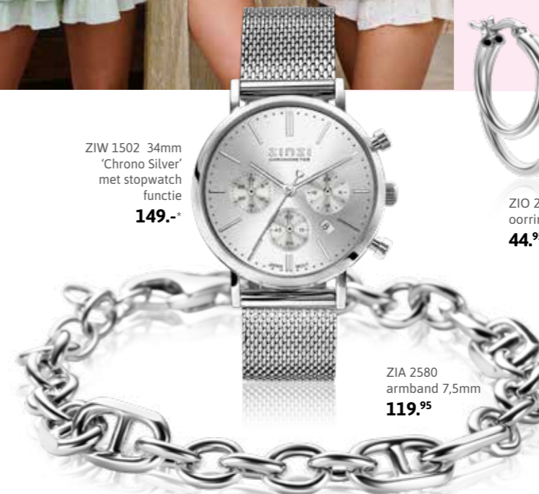
ZIA 2580 armband 7,5mm 119,95