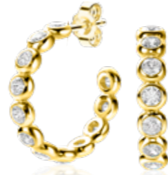
ZIO 2573Y oorkingen 22 x 4mm 79,95

De zilveren sieraden van Zinzi zijn makkelijk met elkaar te combineren. En draagbaar voor iedere vrouw. Voldoende keuze!