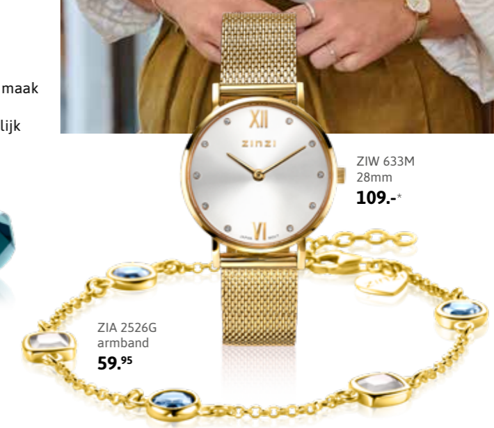
ZIW 633M 28mm 109.-*