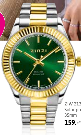
ZIW 2135 Solar powered 35mm 159.-*