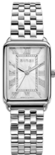
ZIW 1906 28mm 'Elegance Silver' 139,-*