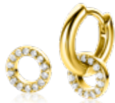
ZICH 2550Y oorbedels 8mm 34,95 p.pr