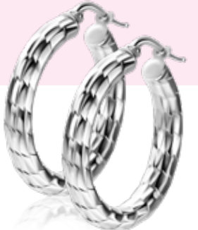
ZIO 2575 oorkingen 27 x 4mm 69,95