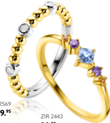
ZIR 2443 39,95