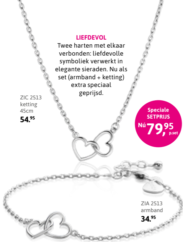
ZIC 2513 ketting 45cm 54.95